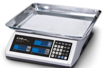
Warenschale ideal für lose Waren – 360×280×55 mm