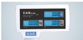
Hinterleuchtete Anzeigen auf Bediener- und Kundenseite mit Abschaltautomatik