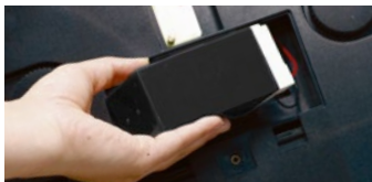
Bis zu 200 Stunden Betriebszeit* mit dem optionalen Hochleistungsakku