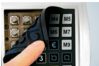
Leichtgängige mechanische Tasten unter der wasserabweisenden Softtouch-Tastaturmatte garantieren ein präzises, ermüdungsfreies Bedienen